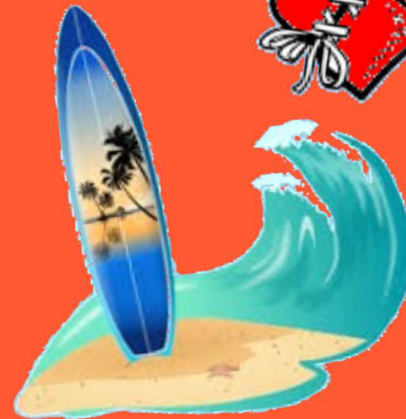
Surf artificiel Jeudi 18 avril