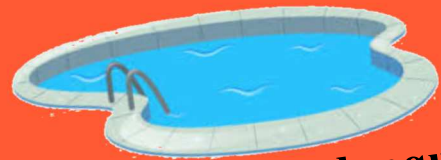
Piscine cassis + calanques (Collégiens qui ne sont pas partis à la nuitée) Vendredi 12 avril