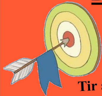
Tir à l'arc*