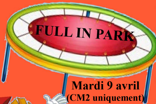
Mardi 9 avril (CM2 uniquement)