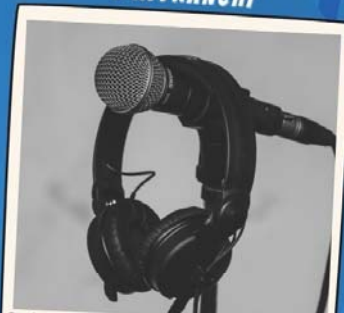
Création et enregistrement d'une chanson dans un studio professionnel