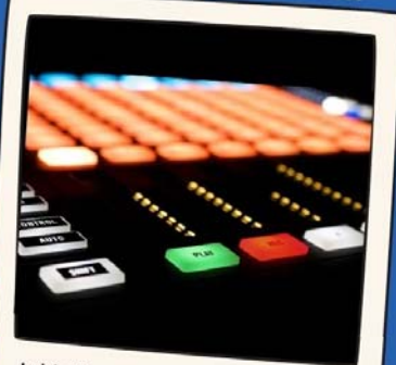
Initiation musicale à l'aide d'un logiciel de musique