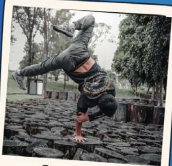
Gym urbaine Yamakasi