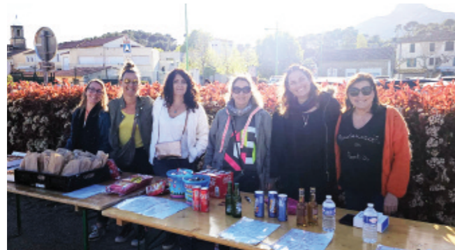
Buvette tenue par les APE des 3 écoles