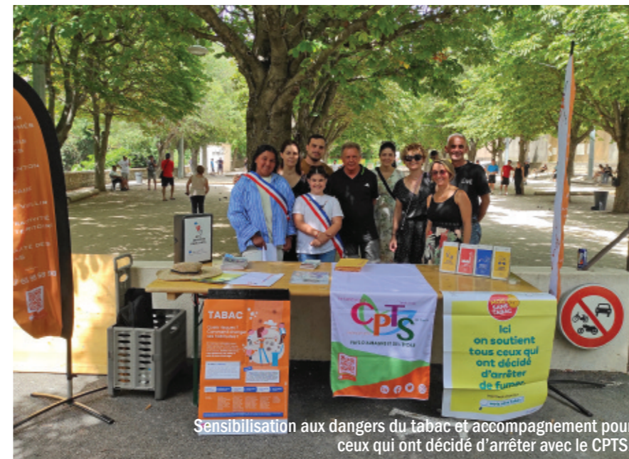
Sensibilisation aux dangers du tabac et accompagnement pour ceux qui ont décidé d'arrêter avec le CPTS.