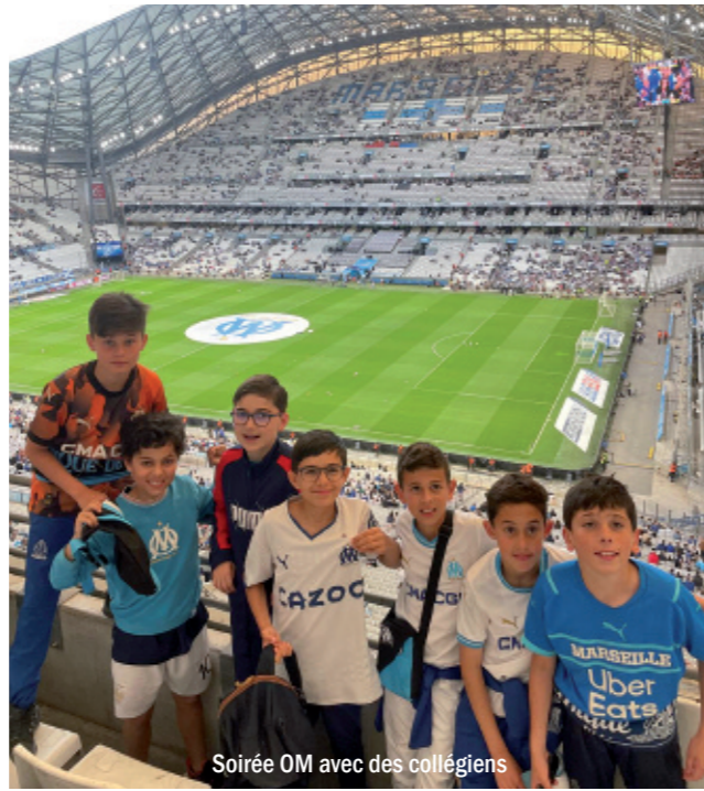
Soirée OM avec des collégiens