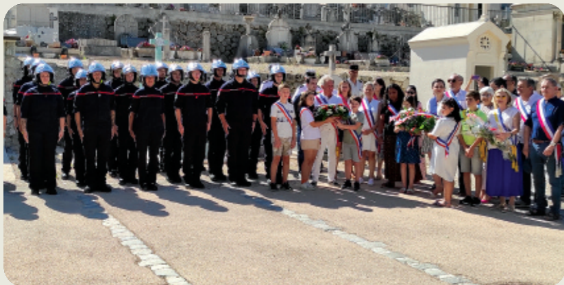
Commémorations et récompenses pour nos Sapeurs-Pompiers à l'occasion de la Fête Nationale du 14 juillet.