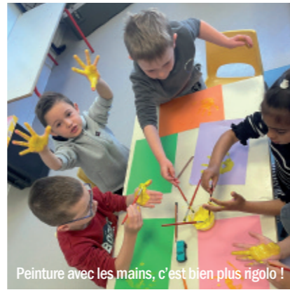
Peinture avec les mains, c'est bien plus rigolo !