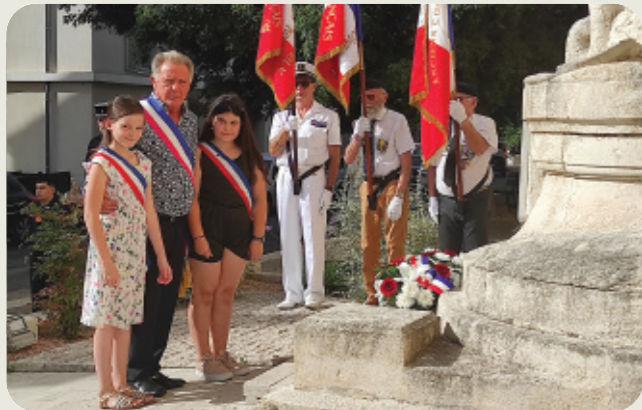
84 ème anniversaire de l'Appel du 18 juin, ce jour où le Général de Gaulle lançait sur les ondes de la BBC un appel à la Résistance.