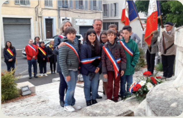
Le 28 avril, recueillement pour tous les génocides perpétrés de par le monde.