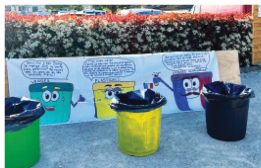
Opération de sensibilisation au tri des déchets, proposée par les animateurs.