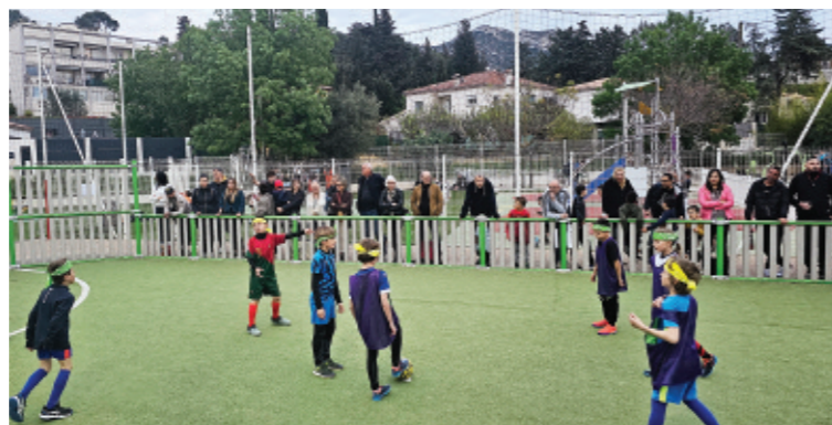
Match CE1 / CE2