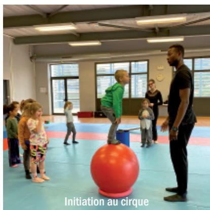
Initiation au cirque