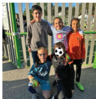
Equipe CM1 Pont de l'Etoile