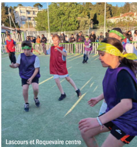
Lascours et Roquevaire centre