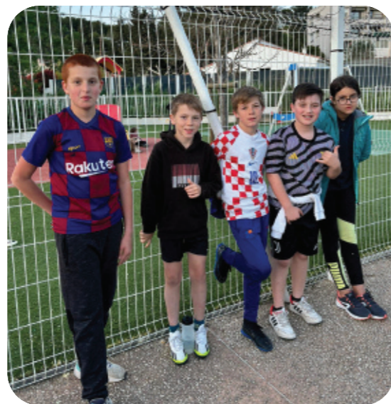
Equipe CM2 Roquevaire

Vingt-six équipes soit plus de deux cents élèves du CE1 au CM2 ont enflammé "les travées" du city stade de Pont de l'Etoile. L'équilibre a été respecté avec la victoire de l'école du centre en CM2, celle de l'école de Pont-de-l'Etoile en CM1 et celles des CE2 et CE1 revenant à l'école de Lascours. Il est à noter, et comme l'a souligné notre Maire à l'occasion de la remise des médailles, de plus en plus de jeunes filles prennent part à ce tournoi. Bravo à elles ! L'occasion nous est donnée de remercier le FCEH, notre club intercommunal, qui s'est chargé de l'arbitrage.