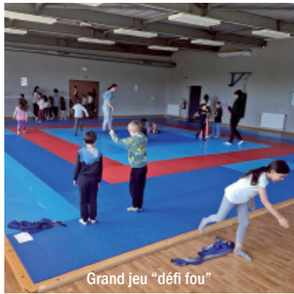
Grand jeu "défi fou"