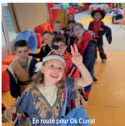
En route pour Ok Corral