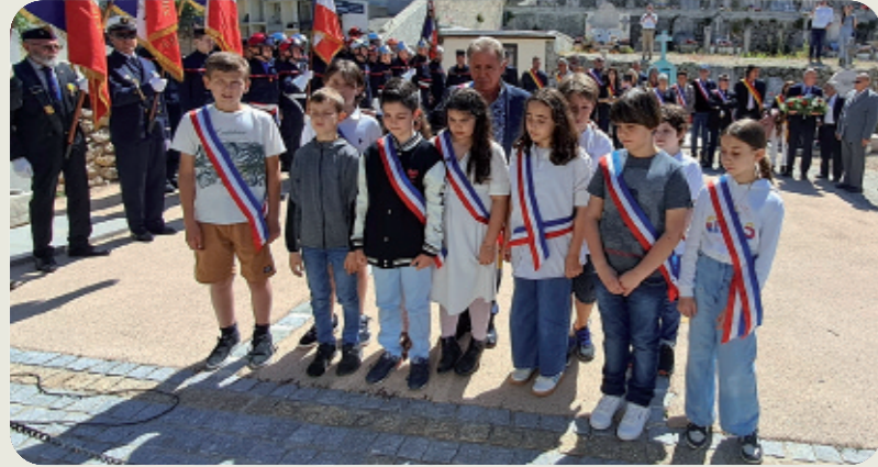
Le 8 mai, 79 ème anniversaire de la Victoire de 1945, pour se souvenir, pour transmettre et célébrer la liberté.