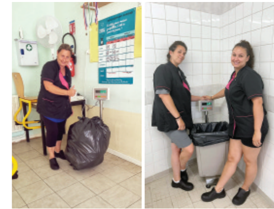
A Lascours, Roquevaire et Pont de l'Etoile, les biodéchets sont triés, pesés. Certains aliments sont mis dans des conteneurs hermétiques et ventilés afin d'assurer leur conservation à destination des animaux.

Une convention a été signée avec l'association Hypoterra qui gère la ferme pédagogique. Elle récupère les déchets alimentaires des restaurants scolaires. Environ quatre-vingt kilos de nourriture sont distribués à "Georges" le cochon et "ses compagnons" chaque jour. Le site de l'école Martinat a obtenu les félicitations des services métropolitains sur l'efficacité de la mise en pratique et de la tenue des bacs de tri alimentaires.