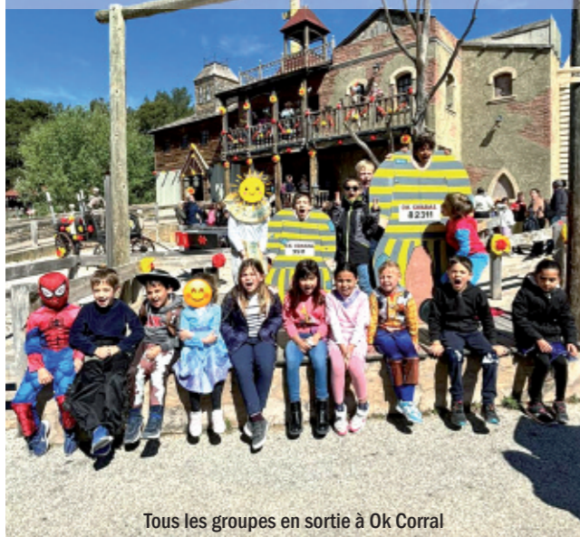
Tous les groupes en sortie à Ok Corral

En moyenne 52 enfants maternels, 55 élémentaires et 22 jeunes ont été accueillis pendant ces vacances de printemps avec des activités sur le thème "Tous en Scène". Une veillée plateau télé "Pop Star" et une sortie à Ok Corral ont complété le programme. Du côté des ados, 7 collégiens ont profité d'une soirée au stade Orange Vélodrome.