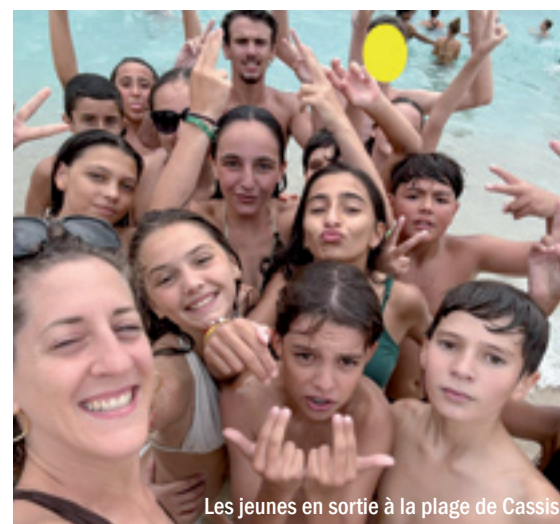
Les jeunes en sortie à la plage de Cassis