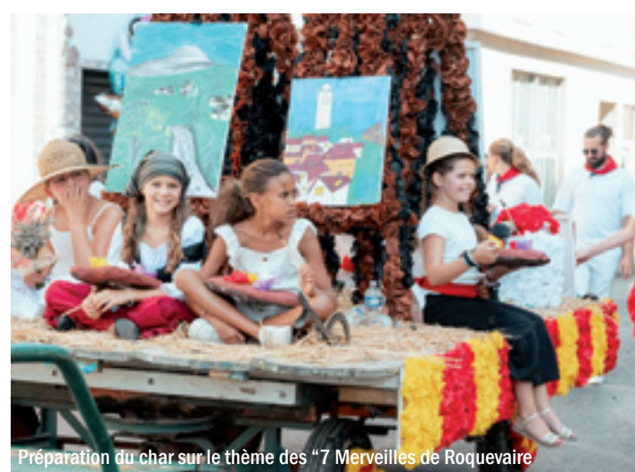
Préparation du char sur le thème des "7 Merveilles de Roquevaire"