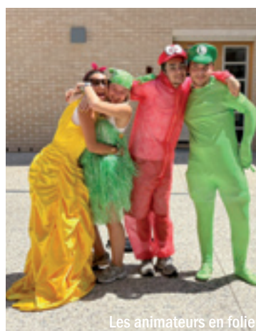
Les animateurs en folie