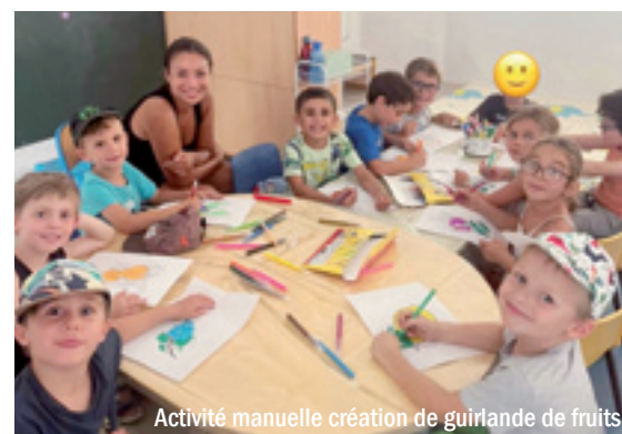
Activité manuelle création de guirlande de fruits