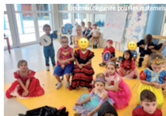
Journée déguisée pour les maternels