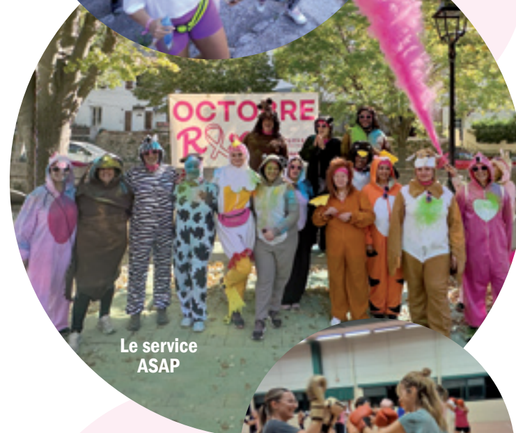
Le service ASAP