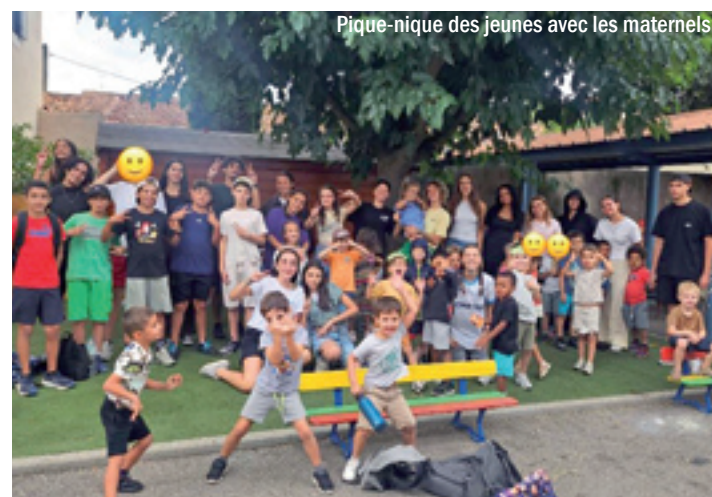
Pique-nique des jeunes avec les maternels