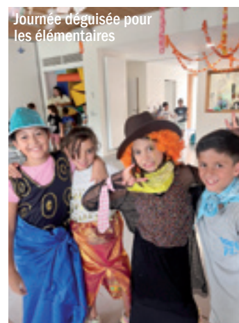
Journée déguisée pour les élémentaires